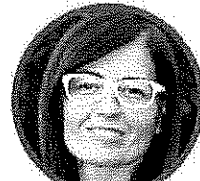
MARIE ANNA FEBBRAIO SECONDARIA DI PRIMO GRADO