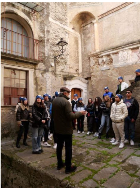
Figura 10 abitazione ebraica rione Civita di castrovillari