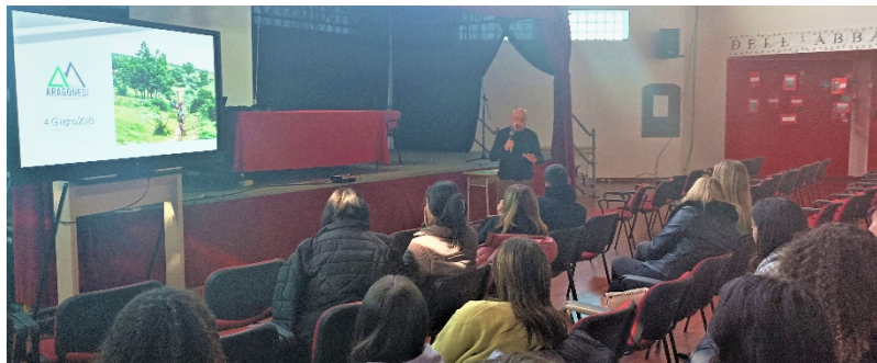
Figura 6 la maratona degli Aragonesi evento sportivo in MTB