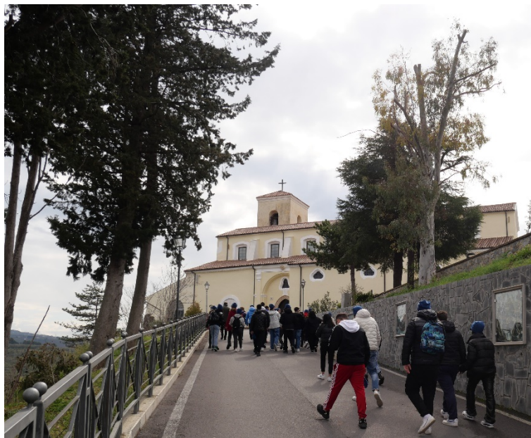
Figura 8 a piedi come i pellegrini verso la basilica inferiore M.nna del Castello