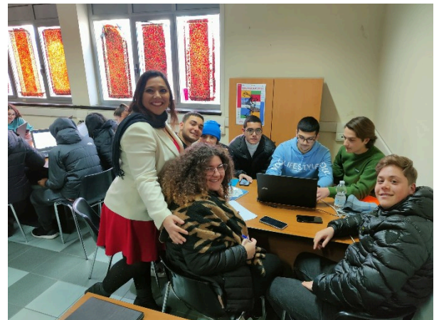
2 work in group