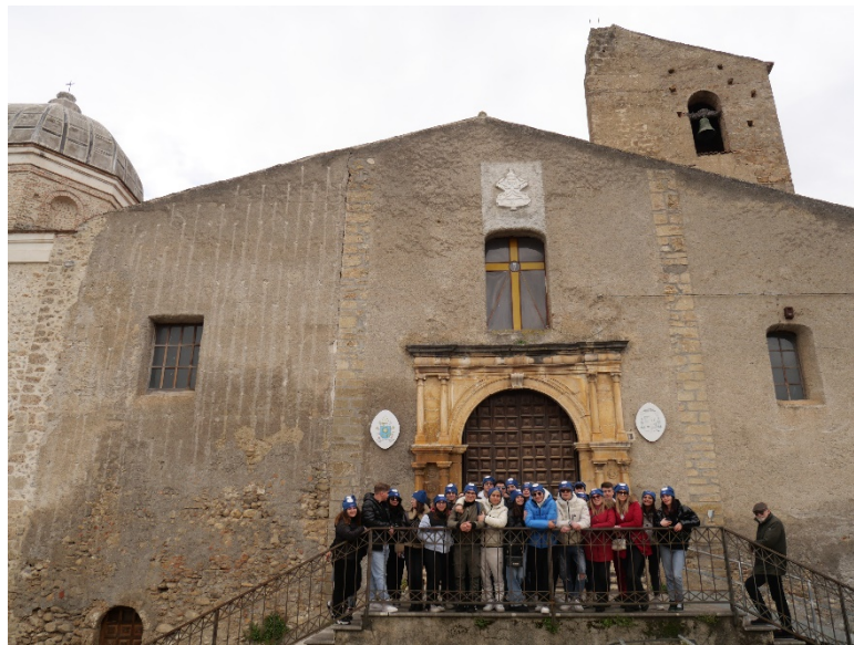
Figura 9 chiesa S. Giuliano e Museo d'Arte Sacra