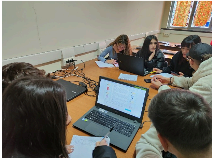
1 work in group sui prodotti locali a kmo da inserire nelle Vie Eno Gastronomiche