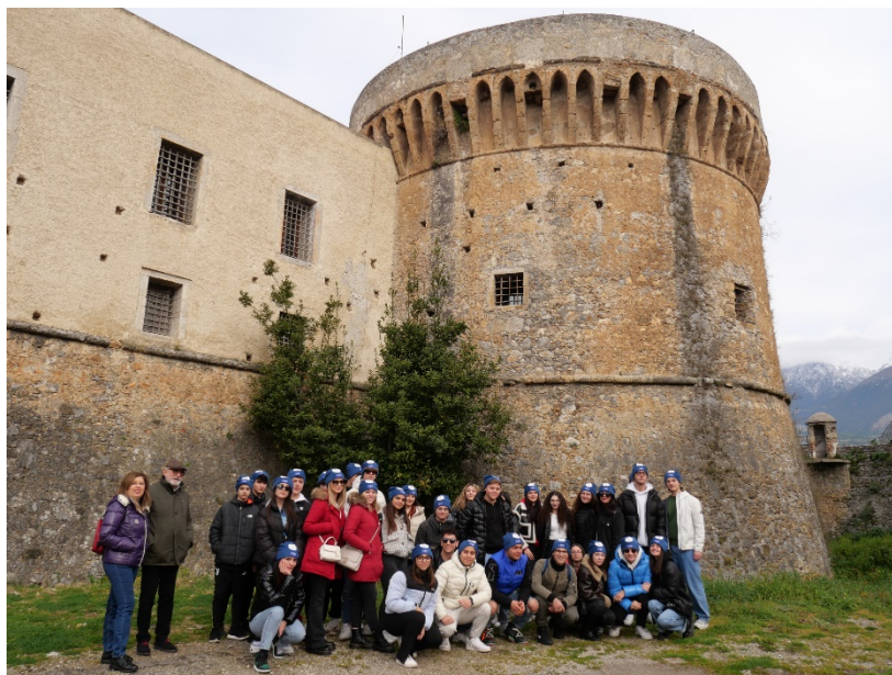
Figura 7lezione di storia a cura di G Trpmbetti