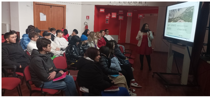
lezione esperta in agricultural management nd farming products